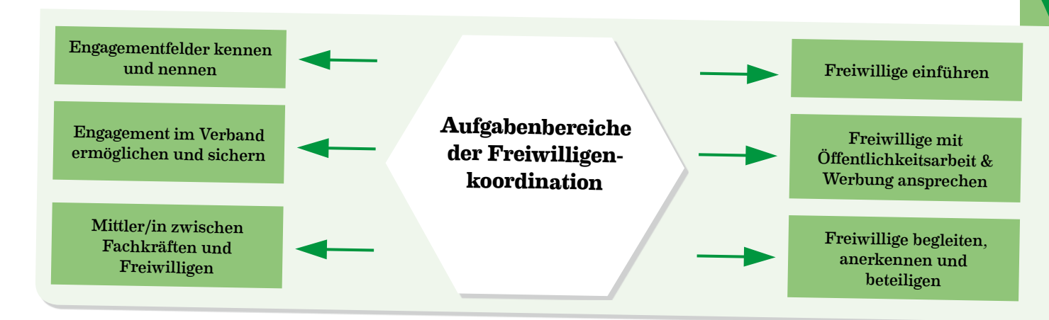
Grafik: Eigene Darstellung

In diesem Workshop standen vor allem die Erfahrungen der Teilnehmenden mit einer gezielten Freiwilligenkoordination beziehungsweise einem umfangreichen Freiwilligenmanagement im Mittelpunkt. Freiwilligenmanagement befasst sich damit, wie ein zielgerichteter Umgang mit Freiwilligen in den Verbänden zustande kommen kann. Welche Planung, Organisation und Koordination der Freiwilligen sinnvoll, effizient und möglich sind. Und welchen Service und Unterstützung man den Freiwilligen für den Einstieg in die Ehrenamtsarbeit bieten muss. Als Einstieg in das Thema wurde den Teilnehmenden zunächst eine Kurzübersicht zu den unterschiedlichen Aufgabenbereichen von Freiwilligenkoordination vorgestellt: